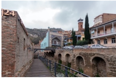
Die Schwefelbäder im historischen Altstadtviertel von Tbilisi.