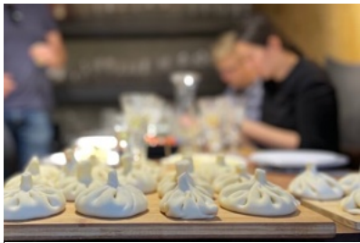
Khinkali-Kochkurs in Mananas Marani in Lagodekhi