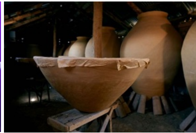
Qvevri Workshop in Telavi