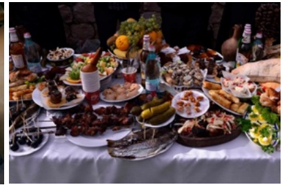
Qvevri-Workshop in Telavi