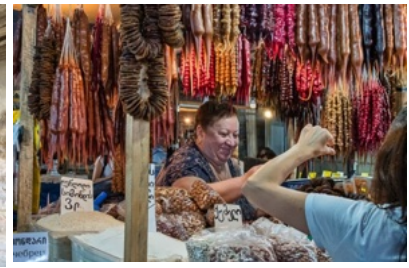
Eine Frau, die auf dem Bauernmarkt von Telavi Churchkhela und lokale Gewürze verkauft.