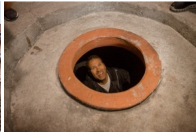
Biomarani. Der Gastgeber reinigt gerade den Qvevri und bereitet ihn für die Weinherstellung vor.