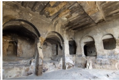
Mittelalterliche Höhlen der Höhlenstadt Uplistsikhe