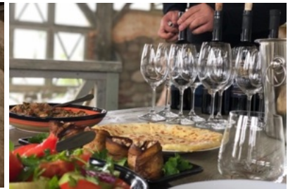
Weinverkostung im Weingut Tsinandali.