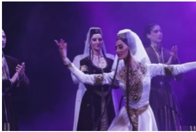
Georgische Tanzaufführung beim Tsinandali Musikfestival.