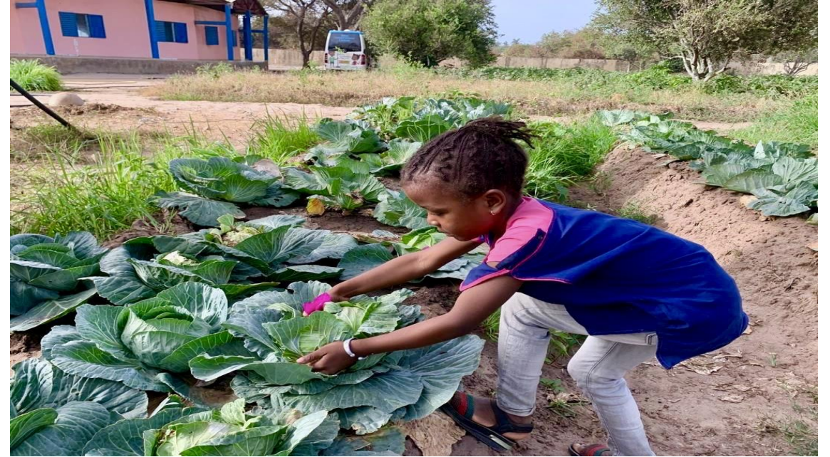
Saaterdäpfel aus dem Mühlviertel